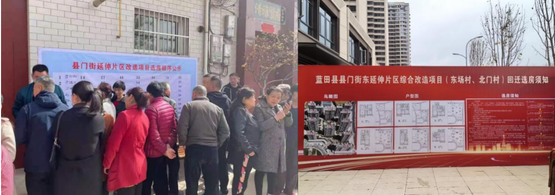
图 7-3 拆迁户选房顺序公示、选房须知