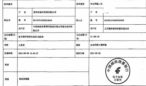
图 5-2 房屋征收补偿费用支付凭证样本