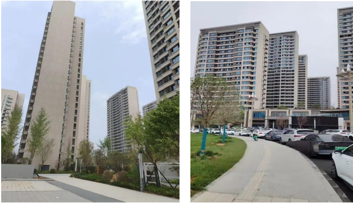
图 5-3 安置小区照片