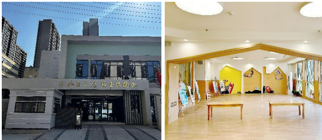
图 2-1：西安市蓝田县第五幼儿园现状图（2024 年 9 月）

7. 现拟使用亚行资金对现有园区范围内（如图 2-1 所示）的设施进行装饰装修和设备采购，以投入使用。具体活动包括地面铺设、墙面乳胶漆、卫生间洁具安装及其他设备采购。2024 年 8 月，本幼儿园已填写移民安置筛选和分类表并提交项目办审核。截止 2024 年 10 月本次尽职调查报告准备期间，子项目活动尚未实施。