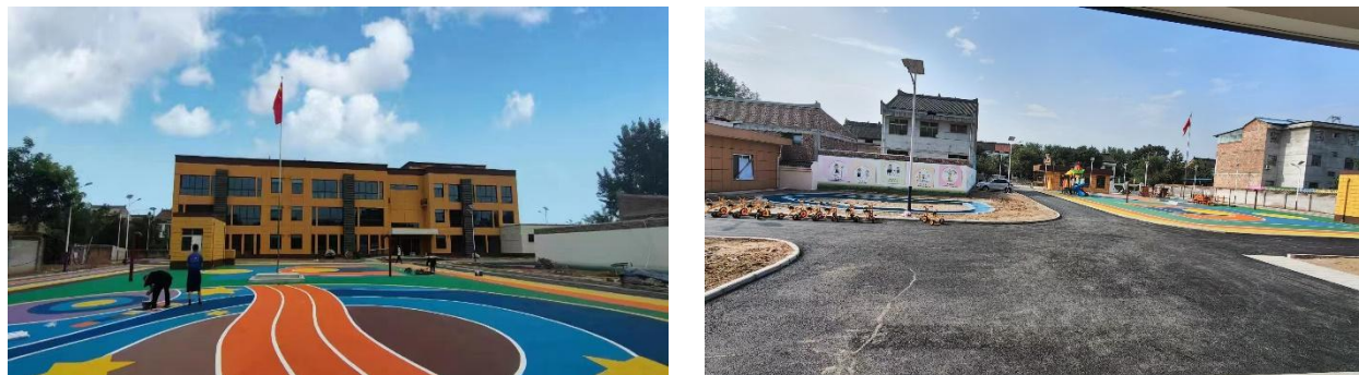
图 2：2024 年 9 月初施工场地现状

8. 子项目建设已于 2022 年 11 月启动。截至 2024 年 9 月，新建综合楼建设已基本完成，其他如管网铺设、活动场地建设等仍在进行中。项目建设场地现状见图 2。