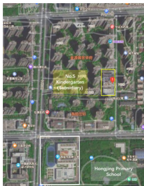
图 2-2:已建成的西安市第五保育院分院（黄线区域）和宏景小学（白线区域）

7. 根据土地红线图（图 2-1）和所取得的土地证（附录 3），西安市第五保育院分院的土地面积为 9.996 亩。然而，尽管与西安市教育局和西安市自然资源和规划局进行了协商，但拟建地点征地的确切日期并不清楚。据有关报告，征地发生在很早以前，网络资料显示征地发生在 20 世纪 50 年代。