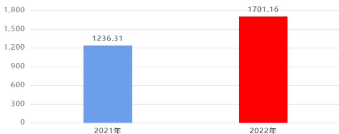
收入、支出决算总计对比图（单位：万元）

2022年度收入总计、支出总计均为1,701.16万元，与上年相比收入总计、支出总计均增加464.85万元，增长37.6%，增长的主要原因是：我单位本年增加教育经费投入。