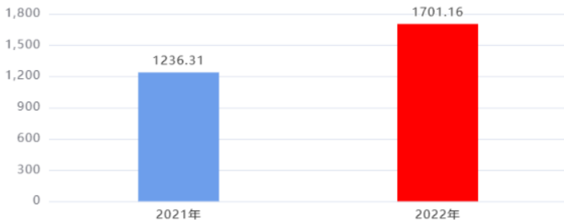
财政拨款支出对比图（单位：万元）

2022年度一般公共预算财政拨款支出年初预算1133.05万元，支出决算1,701.16万元，完成年初预算的150.14%，占本年支出合计的100%。与上年相比，财政拨款支出增加464.85万元，增长37.6%，增长的主要原因是：我单位本年增加教育经费投入。