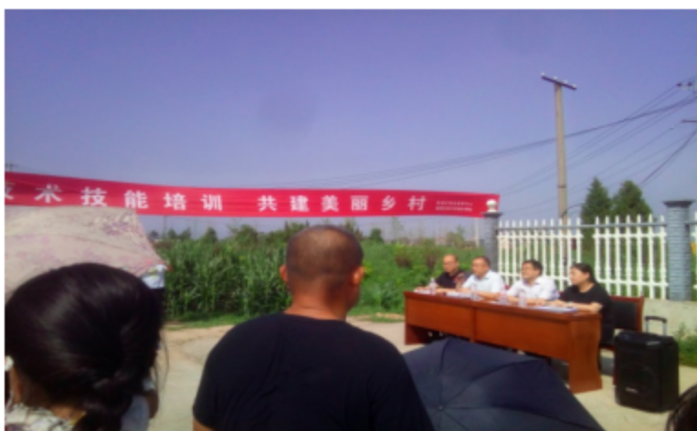
图 14 西安市临潼区职业教育中心职业技能培训

案例 23 技术技能培训，共建美丽乡村。临潼区职业教育中心充分发挥学校家政服务大讲堂优质资源，2022 年暑期开展职业技能、家政服务培训，培训 200 人。在铁炉街道办事处，定期召开“低收入人群实用技术及职业技能”培训会，共培训 500 人。让种植户开阔了视野，丰富了理论知识，学到了更多的实用技术，增强了农民实战能力，对农民科学种植增产增收起到了积极作用。