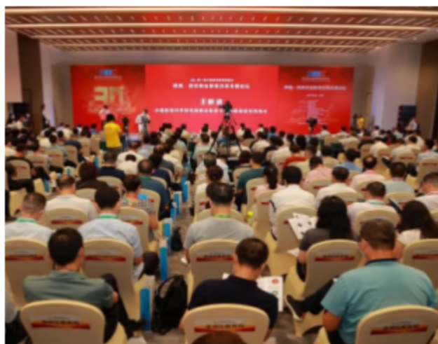
图 18 主旨报告会