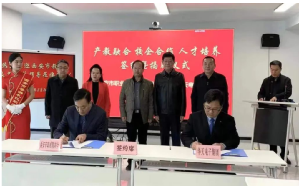
图 10 签约仪式现场

案例 16 西安市特殊教育职业学校校企合作紧密，成效显著。该校分别与陕西振彰食品有限公司（御品轩）、西安精典汽车美容有限公司等多家企业开展常态化交流与合作。通过聘请企业高级技师来校实操指导、选派专任教师深入企业学习培训、邀请企业骨干专家指导教学等多种方式，进一步提升教师的专业知识水平和专业技能。同时把企业作为学生的实习实训基地，重视学生专业技能学习和动手能力的培养，为学生就业与岗位胜任力的提升奠定良好基础。