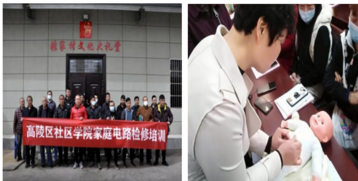
图 13 社区电工培训 月嫂培训

众进行脸谱等非物质培训两场，共计 100 人；为农村青年进行电工知识培训并发放电工工具箱，组织进行月嫂培训和保育员培训，组织校内外学生进行车工、焊工、钳工、数控、界面设计等技能等级培训，共计培训人数达 1000 余人。