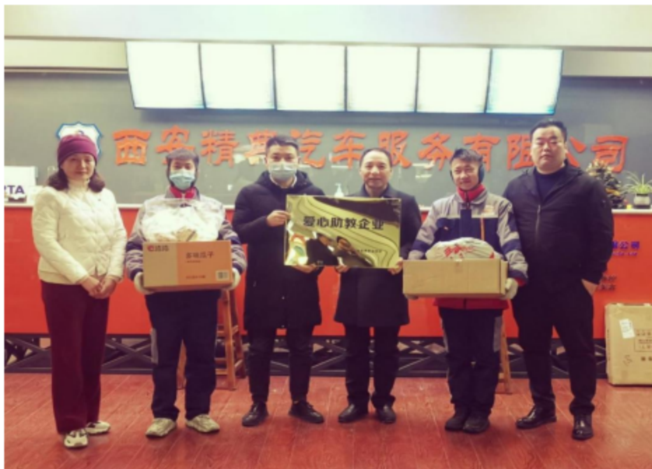
图 11 西安市特殊教育职业学校师生与企业合作挂牌合影