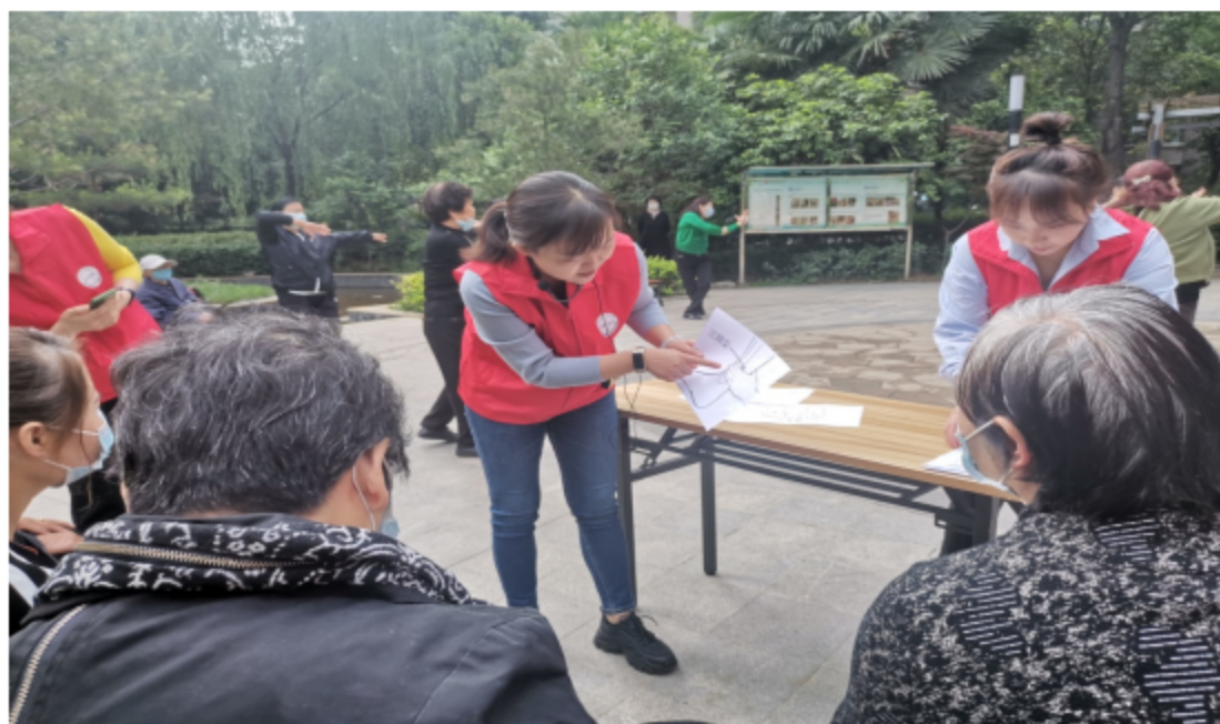
图 15 进社区科普常用穴位的定位方法和穴位按摩方式

案例 25 尊老爱幼扶弱，弘扬传统美德。 西安市卫生学校 2022 年 5 月组织部分教师到碑林区永宁社区荣城小区，为居民科普疫情防控、中医养生保健及婴儿抚触等医学相关知识。向居民们介绍学校护理、医学检验技术及老年人服务与管理专业的基本情况及我国最新修订的《职业教育法》，普及了中医鼻部养生和腿部养生的方法以及常用穴位的定位方法和穴位按摩方式、婴儿抚触操及注意事项等知识。职业教育技能进社区推广了我国的职业教育精神，使社区居民近距离接触到职业教育及与生活息息相关的技术技能。