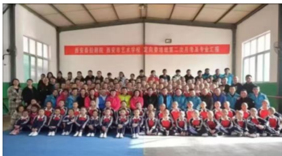
图 16 西安市艺术学校艺术团汇报演出合影

案例 26 西安市艺术学校与西安市秦腔剧院签订秦腔委培班，与富平剧团签订阿宫腔委培班，与企业深入合作联合办学，采用校企双元育人教学模式，教学效果喜人。秦腔委培班学生在代表学校参加的“西安秦腔剧院走进国家大剧院”“西安市职业教育活动月”等活动中初显身手；2021年由秦腔委培班学生呈现的《白蛇传》彩排演出也获得业内一致好评，教学任务完成情况获得委培方的一致认可。2022年秦腔委培班独立成团，挂牌西演青年团。