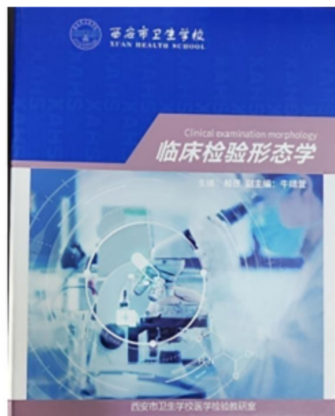
图8《临床检验形态学》“活页式”教材