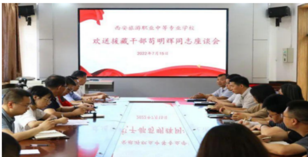
图 9 西安旅游职业中等专业学校欢送援藏干部座谈会