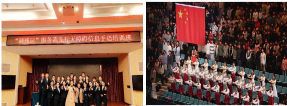
图 17 教师承担手语培训任务和师生参加残运会开幕式

术职业学校全方位深度参与此次活动，共计 65 名师生先后参与了服务等工作，充分体现出学校为残运会服务的责任担当。学校多位领导和教师特邀参与本次开闭幕式全程手语翻译及电视台手语翻译及志愿者手语培训工作、手语翻译及各项服务。