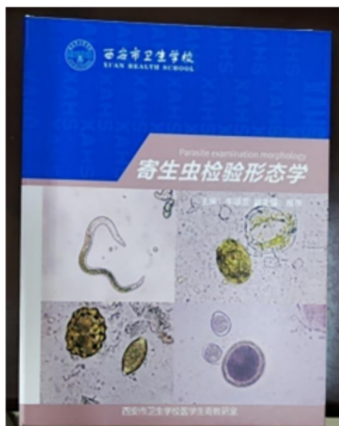
图7《寄生虫检验形态学》“活页式”教材

案例9 西安市卫生学校医学检验教研室编写了《医学检验技术士(师)资格考试“岗课赛证”融通系列教材》《血液学检验形态学》《临床检验形态学》《寄生虫检验形态学》“活页式”教材,医学基础教研室编写了《解剖学基础》“工作手册式”教材。