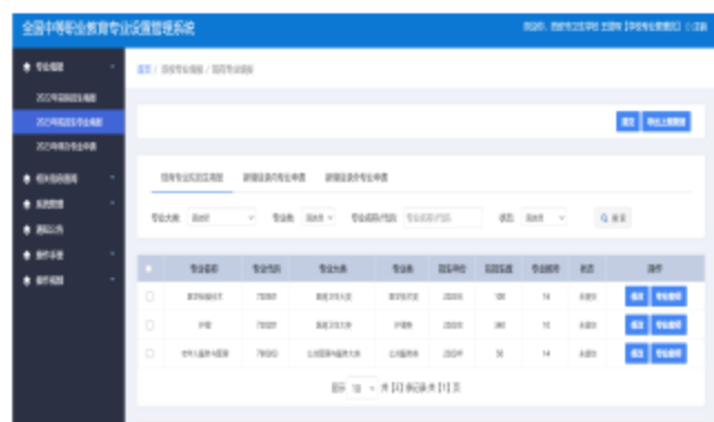
图 3 建立了完善的专业人才培养方案

案例 2 西安市卫生学校组织各教研室主任及教学骨干对护理、医学检验技术专业 and 老年人服务与管理专业现状，深入医院及护理机构进行充分的行业调研与探讨，与相关企业对三个专业的人才培养方案、专业教学标准及课程标准进行了优化和调整，进一步推进国家教学标准落地实施，提升职业教育质量，创新人才培养模式。