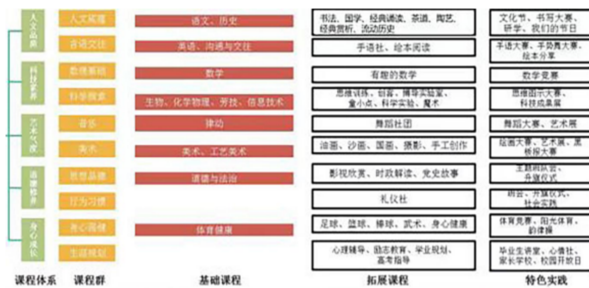
图 5 西安市残疾人艺术学校学校课程体系建构和课程框架

案例 5 西安市残疾人艺术学校以学生为中心，以学生终身发展的为导向，围绕工艺美术的相关内容，进行课程的开发与设置，同时还开设了装裱、图文印刷、油画等相关课程，给学生更多自主选择的空间，关注学生的个性化发展。同时学校的课程设置还充分考虑到了教师角色转换，即由执行者转变为课程开发的参与者、设计者、实施者和考评者，教师通过加强学习，具备课程意识和课程开发能力，加强学科学习与专业技能提升，更新职业教育观念，提高自身的教育教学能力，从而促进课程建设质量的提升。